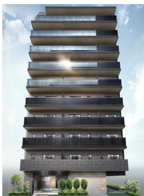
外観完成予想図は図面を基に描き起こしたもので、外観・内装等は多少異なる場合があります。