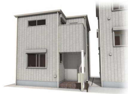
イメージパース ※本パースはイメージとし、実際と異なる場合がございます。